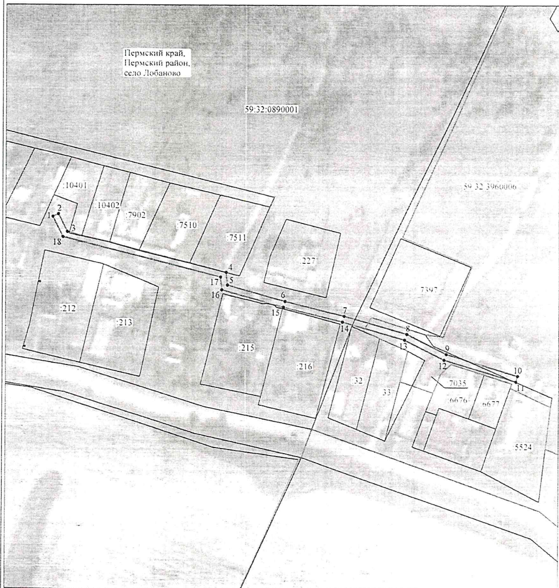
Схема расположения граници публичного сервитута объекта